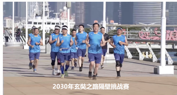
2030年玄奘之路隔壁挑战赛