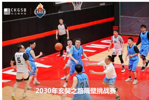
2030年玄奘之路隔壁挑战赛