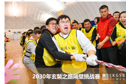
2030年玄奘之路隔壁挑战赛