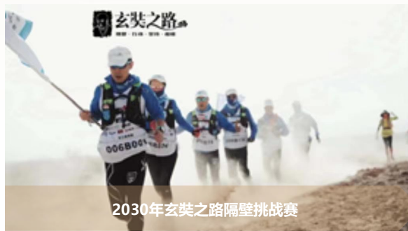
2030年玄奘之路隔壁挑战赛