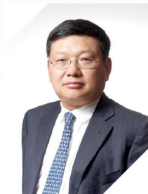
长江商学院创办院长 中国商业与全球化教授

希望我们培养的企业家学员们，在考虑商业决策的时候，也会考虑人类未来真正的长远利益，从而由富足的生活走向丰盈的人生，为中国乃至全球的经济、社会、环境的可持续发展和包容性增长贡献长江人的一份力量。构建责任共识！